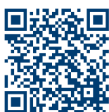
Mehr zu Fiori Apps

HEISAB bietet bereits jetzt eine Vielzahl sofort einsatzbereiter und praxiserprobter Apps entlang der gesamten Wertschöpfungskette, z. B. für die Bereiche: