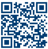
Mehr zu IDX

strategie zu unterstützen. So machen wir aus den Produktionssystemen unserer Kunden hochflexible, vernetzte und agile Einheiten – ganz im Sinne der Industrie 4.0.